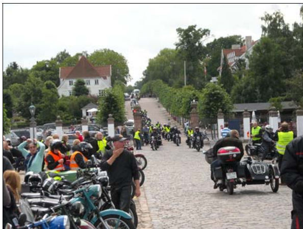
Från årsträffen 2009. Det är säkert redan 150 ekipage som kommit till rasten vid Fredensborgs slott, men fortfarande rullar flera in...

En årsträff är en upplevelse, ett par hundra Nimbusar, varav oftast en handfull Kakkellovnsrør, på ett ställe och ännu flera glada Nimbusentusiaster. Att gå omkring och botanisera bland alla motorcyklarna och prata med människor är roligt, intressant och spännande. Den gemensamma turen är också en upplevelse. Glada vinkande åskådare längs vägkanten och då och då kan man se den långa karavanen av motorcyklar framför sig på raksträckorna. Det är lätt att få känslan när man kommer fram att de sista inte startat än!