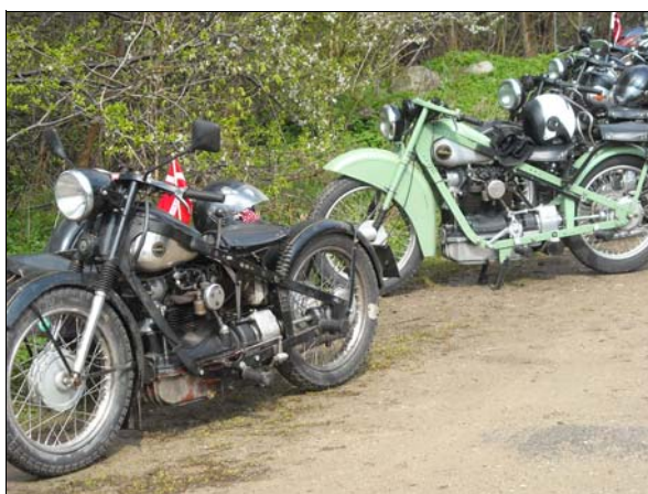
Från Fladjernstræffet 2012.