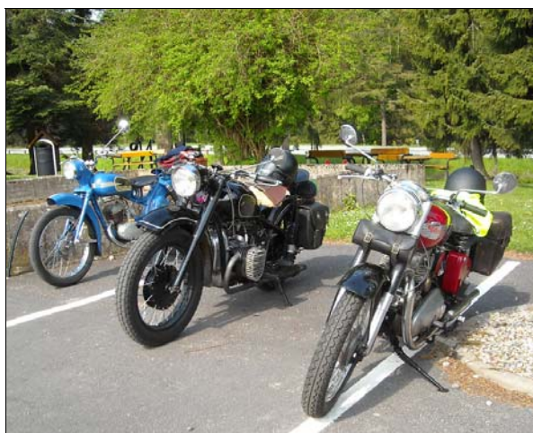
Tre av ekipagen från Råbelöfsturen, Husqvarna, Ural och Royal Enfield, summa fem cylindrar!