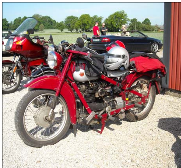
Tre Nimbussar förgyllde Skånerrallyt 2012

är skånsk äggkaka med stekt fläsk på friluftsmuseet Kulturens Östarp - vi tog nog om allihopa!. Det var många deltagare och cyklarna var från 1920-talet och framåt. Kaffe, goda samtal och prisutdelning avslutade en trevlig dag!