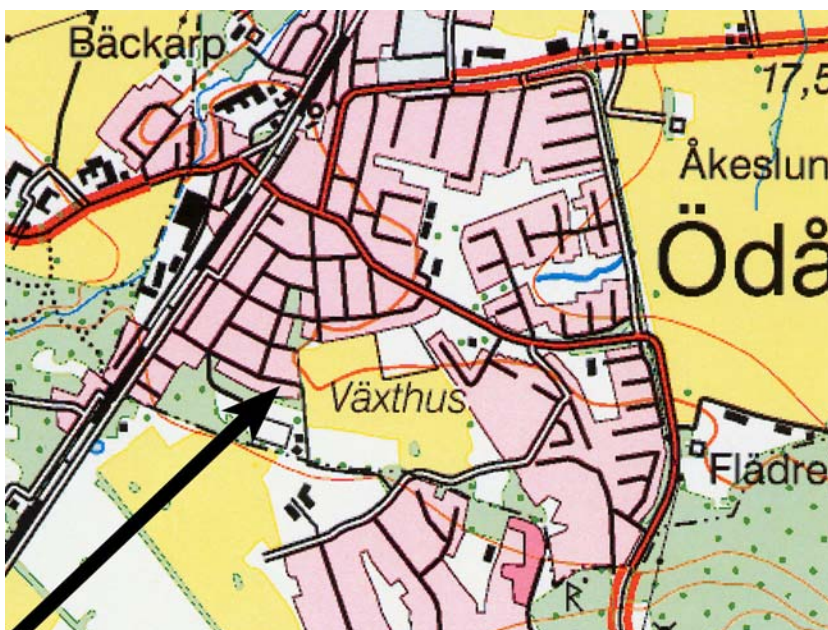
Karta över Ödåkra. Kör in N P Mathiassons gata längs järnvägen och därefter fram till Toftagatan 22!